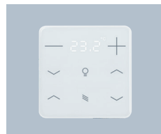
Taster für Temperatur- regelung, Licht und Sonnen- schutz KNX eTR 208 Light/ Sunblind Elsner 7119x