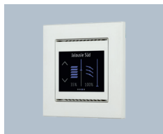
2x Raum-Controller mit Touch-Display Cala Touch KNX T Elsner 7080x