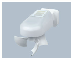
Wetterstation Windancer KNX-GPS Elsner 71236

Im Beispielprojekt verwendete Geräte-Applikationen: