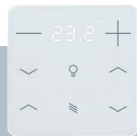
KNX eTR 208 Light/Sunblind