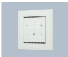
Raumtemperatur-Regler und Taster für Sonnenschutz Cala KNX T 201 Sunblind Elsner 7099x