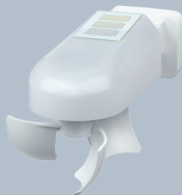
Wetterstation Windancer KNX-GPS