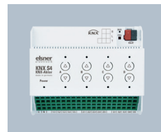
2x Aktor für Antriebe Auf/Ab KNX S4 Elsner 70540 für Fenster, Markise, Roll- laden, Jalousie