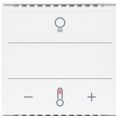
Cala KNX MultiTouch T Light CH Números de artículo 70951 (blanco), 70953 (negro)