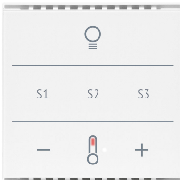
Cala KNX MultiTouch T Light/Scenes CH Números de artículo 70961 (blanco), 70963 (negro)