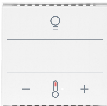
Cala KNX MultiTouch T Light CH Artikelnummern 70951 (Weiß), 70953 (Schwarz)