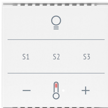
Cala KNX MultiTouch T Light/Scenes CH Artikelnummern 70961 (Weiß), 70963 (Schwarz)