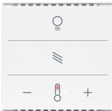
Cala KNX MultiTouch T Light/Sunblind CH Artikelnummern 70891 (Weiß), 70893 (Schwarz)