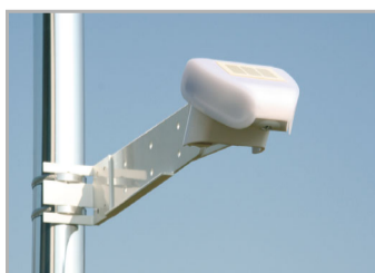
Fig. 2 montaggio su un palo con fascette con filettatura a passo elicoidale