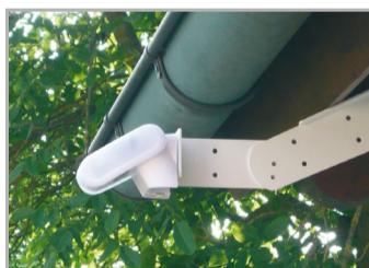
Fig. 1 grazie all'utilizzo del braccio articolato la stazione meteo sporge da sotto il cornicione del tetto. Pertanto sole, vento e precipitazioni influenzano i sensori senza limitazioni.